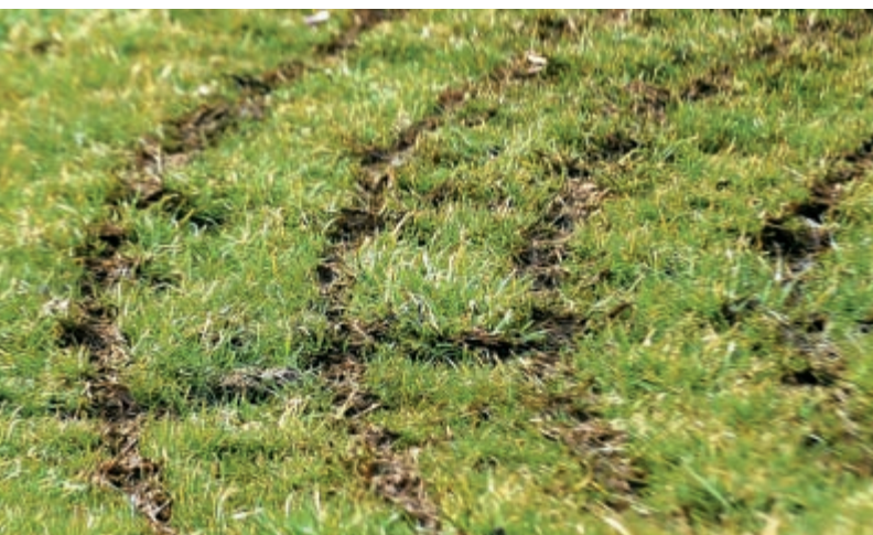
Die von den Schläuchen erzeugten «Strohwürstchen» sind nur dann ein Problem, wenn sie auf, statt zwischen den Gräsern abgelegt werden.