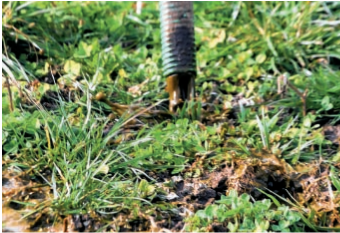
Richtig: Die Schläuche werden leicht über dem Boden geführt, und die Gülle kann so schonend und ohne Spritzer abgelegt werden.