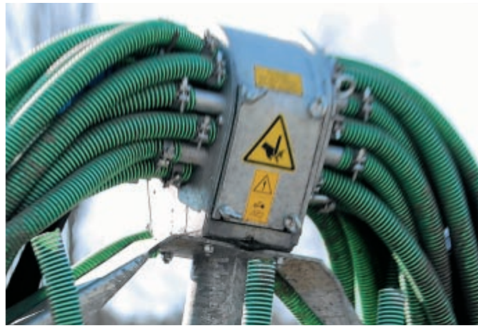
Jeder Schleppschlauchverteiler sollte mit einem Fremdkörperabscheider ausgerüstet sein, der unten über einen Schieber entleert wird.

Damit keine Störungen durch Fremdkörper auftreten, sollte vor oder im Verteilerkopf ein Abscheider eingebaut sein, den man über einen Schieber entleeren kann. Eine immer