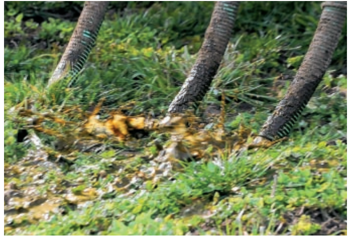
Falsch: Werden die Schläuche über den Boden geschleift, trifft die Gülle schräg auf die Grasbüschel, was zu vermehrter Spritzerbildung führt.

nigen und die Messer und Gegenschneiden mit etwas Öl vor dem Anrosten zu schützen.